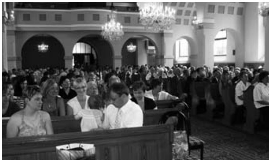
Zborové zhromaždenie počas rozlúčky so zborovým farárom