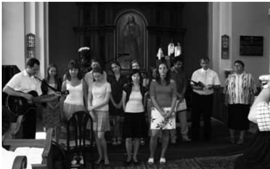
Pozdrav dorastu pri rozlúčke so zborovým farárom