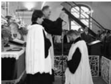
Slávnostný akt inštalácie