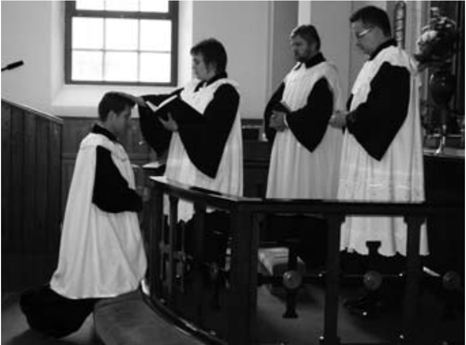
Požehnanie od seniorky pre nového zborového farára

– náš zdroj sily je v milosti Pána Ježiša Krista. Nie je lepší zdroj. Zdôraznil, že potrebujeme byť vytrhnutí z hriechu, nie snažiť sa vylepšovať svoj život. 2. Počul si pred mnohými svedkami... – budme vďační za všetkých ľudí, ktorých Pán Boh akýmkoľvek spôsobom použil na náš kresťanský rast. Pamätajme, že v kresťanstve nie sme prvolezcami, ale sme súčasťou Kristovej cirkvi. 3. Zveruj to spolahlivým ľuďom – čiňme učeníkov, ako to robil Pán Ježiš, ale pamätajme tiež na to, že to, čo Pán Ježiš chce, je, aby sme boli predovšetkým s Ním. 4. Schopní aj iných vyučovať – buduj spolupracovníkov, radšej nech niečo menej dôležitejšie ustúpi, ale dôležité je, aby v zborovej práci, pri budovaní Božieho kráľovstva, mohli byť zapo-