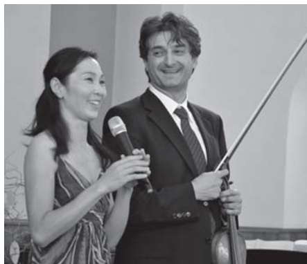
koncert japonských umelcov