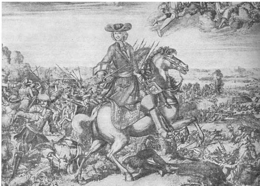
Poltava, júl 1709

Eventuálnym uhorským utečencom z náboženských dôvodov poskytnúť