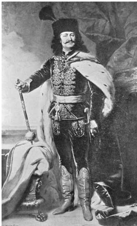
František II. Rákoczi

U otvoreného listu ako vydavateľa dokumentu figurovali „evanjelické stavy augsburského vyznania, predsedovia, seniory a prísediaci preddunajských, predtiských a zatiských konzistórií“, u interných písomných pokynov bol tento list pozmenený v tom duchu,