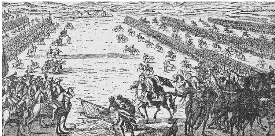
Kapitulácia konfederovaných stavov Uhorska na kismantejskom poli, máj 1711

útočisko na švédskom území. Obom vyslancom kráľovská kancelária vydala ochranný sprievodný list, ale bezpečnostná situácia bola taká nepriaznivá, že trvalo ešte celý rok, než sa na konci augusta 1709 s Meijerfeltovým a Bardiliho diplomatickým sprievodom dostali na sedmohradskú pôdu.