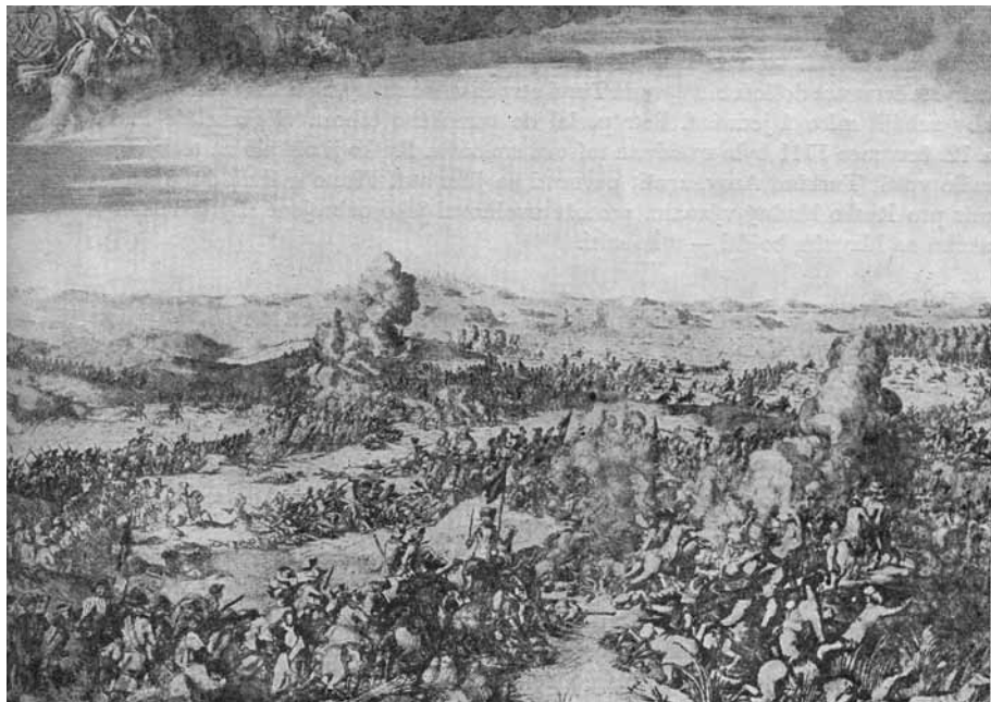
Koniec nádeji švédskeho kráľovstva a evanjelikov v Uhorsku